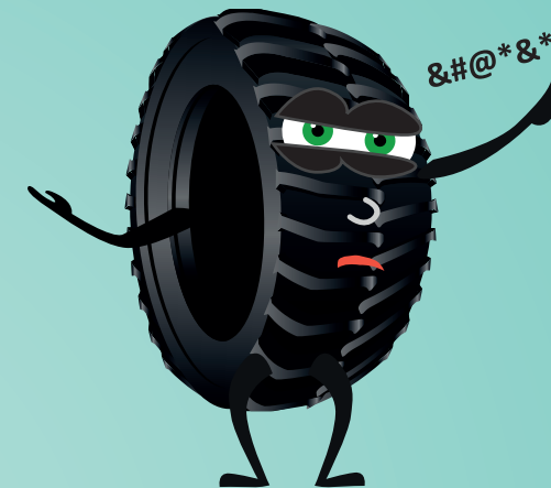
Váš výrobce pneumatik