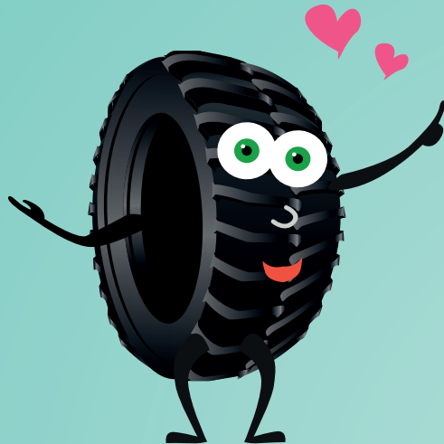
Váš výrobce pneumatik